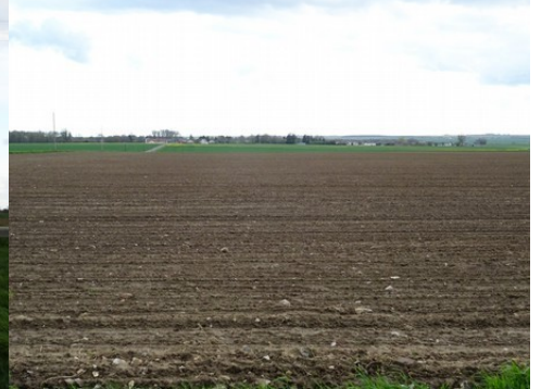
La vue vers le village de Mouflaines