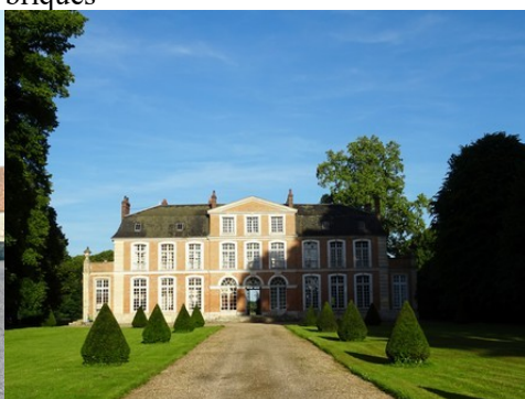
Le château de Mouflaines