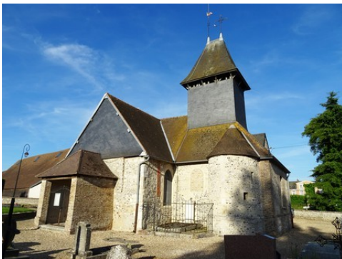
L'église de Mouflaines

Il s'agit d'une zone qui n'a pas vocation à être urbanisée. Seuls des bâtiments annexes au monument historique et/ou dans le strict respect de son style peuvent être envisagés.