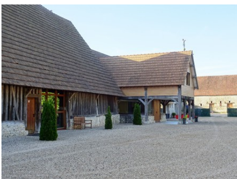
La ferme dite de la Forge