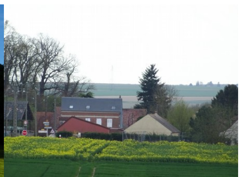
L'entrée de Mouflaines depuis le moulin