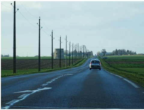
Le moulin vu de la route