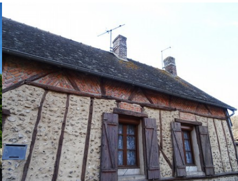
L'usage de pans de bois, moellons, Des portails avec murs de clôture briques