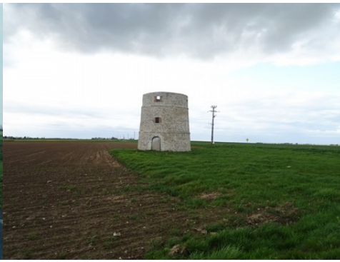
Le moulin et les champs alentours