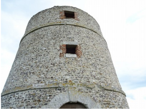
Les maçonneries et les arases restaurées