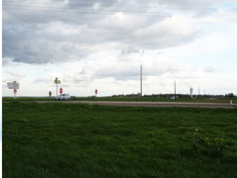
La plaine cultivée environnante