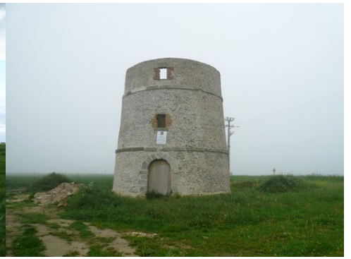
La tour du moulin (vue proche)